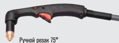
Ручной резак 75°

(дополнительные варианты резаков см. на веб-сайте www.hypertherm.com )