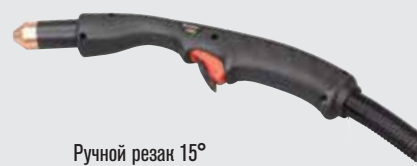
Ручной резак 15°