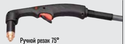
Ручной резак 75°

(дополнительные варианты резаков см. на веб-сайте www.hypertherm.com )