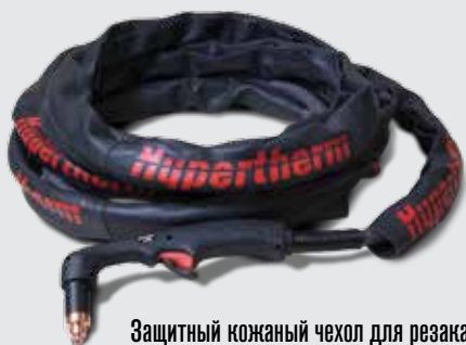
Защитный кожаный чехол для резака