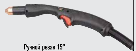
Ручной резак 15°