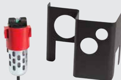
Комплект для фильтрации воздуха