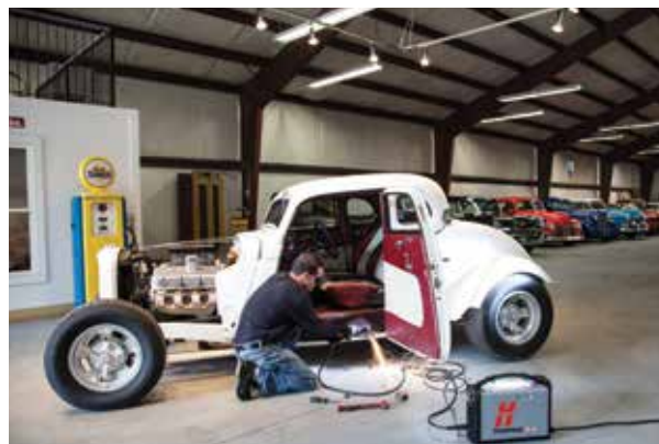
Ремонт и переоборудование машин