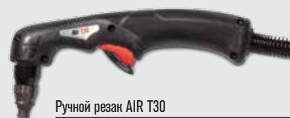
Ручной резак AIR T30